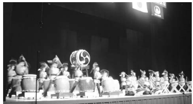
(台中・天祥太鼓の演奏)

紙面の都合上、台湾太鼓公演関連の記事は、引き続き次号(4月発行)で掲載させていただきます。