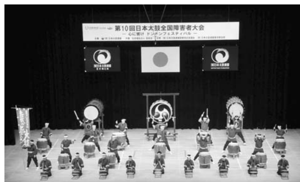
(公演の最後を飾る恵那のまつり太鼓)