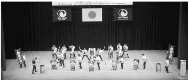
(桐親会和太鼓クラブ)

色々な舞台上で演奏し、経験を積んできました。まだまだ修行中ではありますが、今日も気持ちを合わせてうちます。さらに進化した「桐親太鼓」、どうぞお聞き下さい！