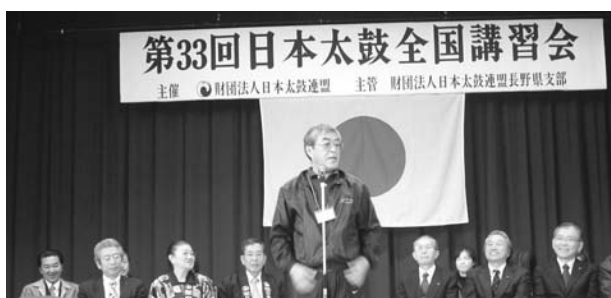
(開会式で挨拶をする古屋支部長)