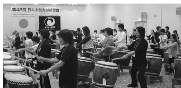
(5級基本講座の様子)

3級検定 9名受験 7名合格 4級検定 18名受験 18名合格 5級検定 61名受験 61名合格