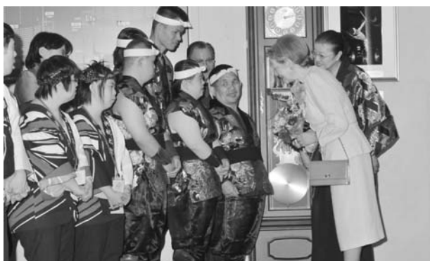
(出演者にお声をかけられる皇后陛下)

10月5日(日)、第10回日本太鼓全国障害者大会が、東京都の文京シビックホールにて開催されました。