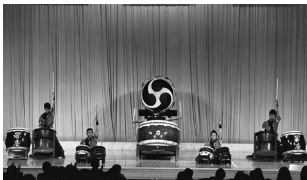
(台湾・勁太鼓の演奏)

優勝：太鼓研修センター「響」(宮崎) 準優勝：轟太鼓道場(宮崎) 第3位：おおむら太鼓連くじら太鼓(長崎) 第4位：熊本市立必由館高等学校和太鼓部(熊本) 第5位：諫早天満太鼓ブルー(長崎) 特別賞：山川ツマベニ少年太鼓(鹿児島)、火の神乙女太鼓爽(鹿児島)、日向の国「響」(宮崎)、華太鼓かんなの会「ふじ組」(宮崎)、志布志ちりめん太鼓(鹿児島)、不知火太鼓Jr(佐賀) 財団賞：霧島九面太鼓保存会 郷花(鹿児島) <参加団体> 50団体 福岡6、長崎5、佐賀7、大分5、熊本7、宮崎13、鹿児島7 特別出演：4団体 「勁太鼓」(台湾ジュニアコンクール準優勝チーム) 中央保育園、住吉東保育園、富吉保育園合同チーム