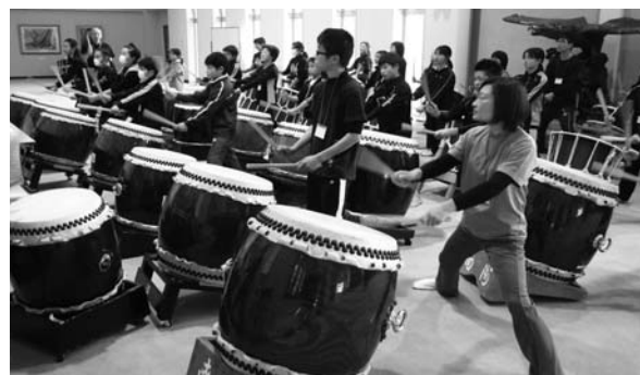
(4級基本講座の様子→)