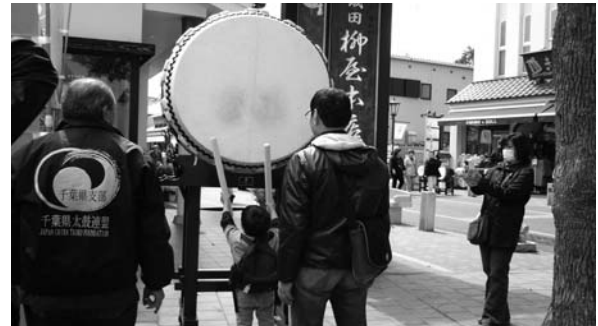
(大太鼓を楽しむご家族)