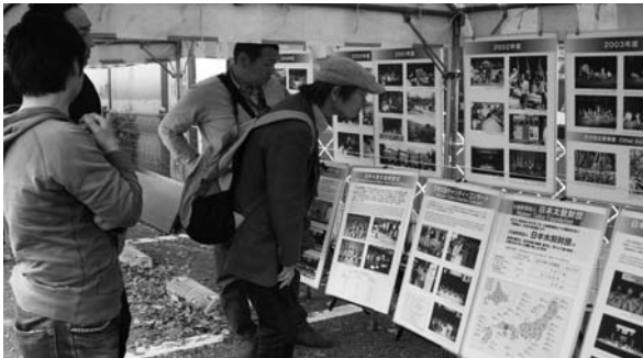
(全国太鼓情報発信基地)

4月13・14日(土日)、千葉県成田市において「成田太鼓祭」が開催されました。今年は両日も天候に恵まれ、22万人もの人が訪れました。千葉県支部、千葉県太鼓連盟主催、当財団の共催により「全国太鼓情報発信基地」のブースを設置し太鼓を紹介致しました。情報発信基地では、事業紹介のパネルを展示したほか、浅野太鼓のご協力を得て大太鼓をお客様に実際に叩いてもらうコーナーを設け、多くの方々が太鼓に親しまれていました。特に外国人やお子さんが多く皆さん思い切り太鼓を打って楽しんでいました。