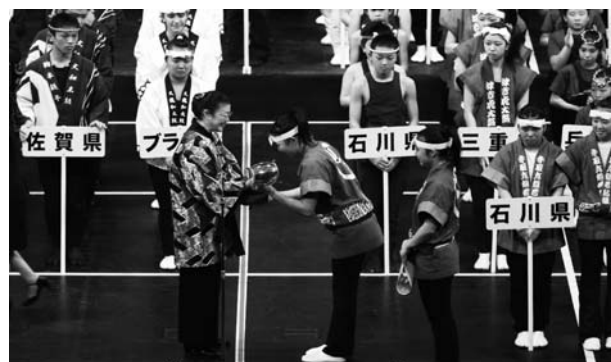
(優勝「手取亢龍若鮎組」・石川)