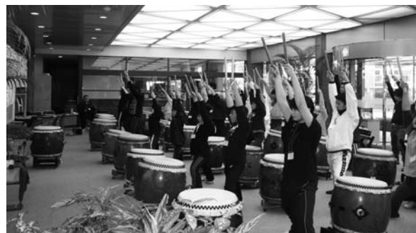
(5級基本講座の様子)