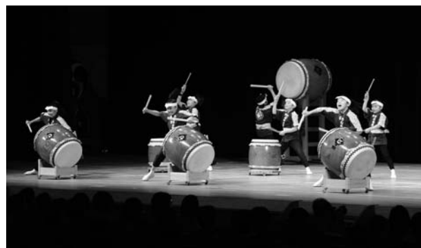
(岩代国郡山うねめ太鼓保存会小若組の演奏)

優勝：岩代国郡山うねめ太鼓保存会小若組(福島) 準優勝：帝京安積高等学校和太鼓部(福島) 第3位：山木屋太鼓(福島) 第4位：和紙の里 和雅美太鼓(福島) 第5位：大曲太鼓道場(秋田) 特別賞：松川一の宮太鼓はな組(岩手)、奥州水沢颯人和太鼓乃会(岩手)、天栄山黄金太鼓保存会(福島) 財団賞：あそびっ鼓組“遊”(青森) <参加団体> 22団体 青森1、岩手5、秋田2、山形2、宮城5、福島7 特別出演：3団体 うねめ太鼓ゆき組(郡山市)、一響乱一和雅美太鼓(二本松市)、山木屋太鼓 山猿(川俣町) * 福島県のジュニア全国大会経験者による太鼓チーム