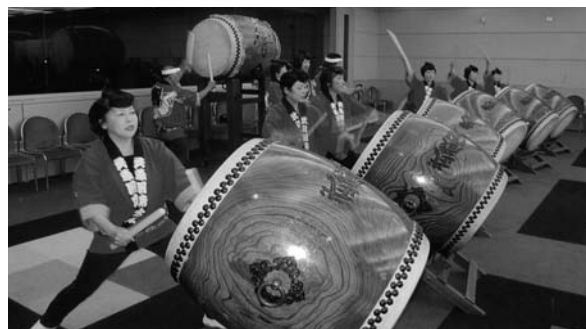
(武蔵国府太鼓の演奏)

今後とも府中市の郷土芸能として武蔵国府太鼓が皆様にさらに愛され、未永く伝承されていくために努力していく所存でございます。