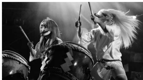
(霧島九面太鼓保存会の演奏)

今後も保存会メンバー一同、いっそうの努力をし皆様のご愛顧にお答えしていく所存でございます。変わらぬご支援、ご協力いただきますようお願い申し上げます。