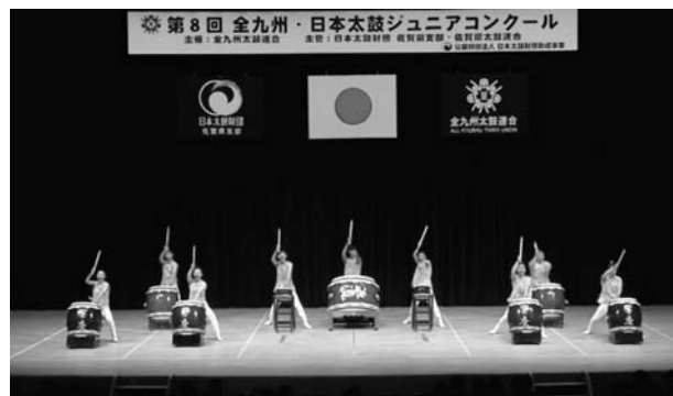
(台湾・泰山太鼓團)