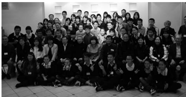
(手取穴龍若鮎組との交流会)

穏やかな春の陽気の中、折しも桜が開花し、「太鼓演奏はもちろんのこと、あこがれの日本で素晴らしい体験をし、一生忘れない良い思い出となった。皆様に感謝したい。学んだことを活かして、これからもがんばって太鼓を続けていきたい」と元気に日本を後にしました。