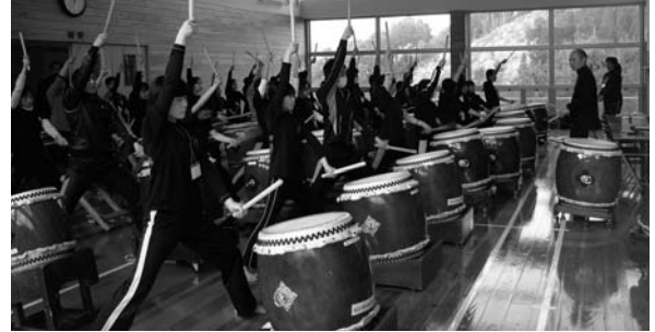
(4級基本講座の様子)