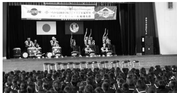
(高椋小学校での演奏)