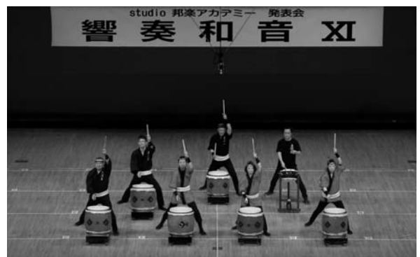
(和太鼓水心会)

和太鼓水心会は発表会に第6回から出場し、今回で6回目の出場でした。日ごろの練習の成果に、観客の皆様から大きな拍手が送られ、出演者はまた来年に向け、気持ちを引き締めていました。