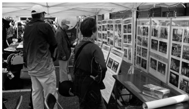
(パネルに見入るお客様)

4月12・13日(土日)、千葉県成田市において「成田太鼓祭」が開催されました。今年は両日も天候に恵まれ、22万5千人もの人が訪れました。千葉県支部、千葉県太鼓連盟主催、当財団の共催により「全国太鼓情報発信基地」のブースを設置し太鼓を紹介致しました。情報発信基地では、事業紹介のパネルを展示したほか、浅野太鼓のご協力を得て大太鼓をお客様に実際に叩いてもらうコーナーを設け、多くの方が太鼓に親しまれていました。特に外国人やお子さんが多く皆さん思い切り太鼓を打って楽しんでいました。