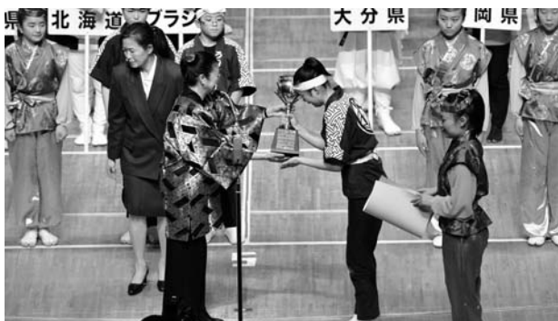
(優勝「岩代國郡山うねめ太鼓保存会小若組」・福島)

また今回は地元開催ということでスタッフの一員も兼ねており、後片付け等に忙殺されろくな御礼も申し上げられず心苦しく思っておりました。全国からお出でになられた皆様に、この紙面をお借りして御礼申し上げます。ありがとうございました。