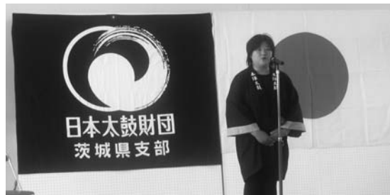
(福崎支部長の挨拶)