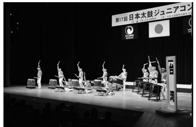
(台湾チームのジュニアコンクールでの演奏)

日本太鼓ジュニアコンクールに参加出来るのは、たくさんの方のご支援、ご協力のお蔭です。心から感謝致します。また、メンバー同士の協力がなければできません。今回の素晴らしい経験を、これからの太鼓の練習、人生の中で活かしていきたいと思えます。これからも不屈の精神で太鼓の練習に励んでいきたいと思えます！本当に有り難うございました。