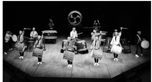
(橘太鼓「響座」ジュニア・宮崎県)