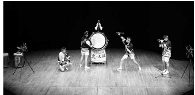
(坂井市無形民俗文化財火の太鼓保存会・福井県)