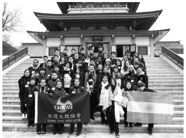
(ブラジル・アルゼンチン・台湾チーム)

日本へ行く事で、日本の文化や言葉をもっと勉強 したくなりました。日本へもう一度行き勉強したい とも思いました。日本という国の事をもっと好きに なりました。太鼓財団の皆様には夢を叶えてくれて、 太鼓をもっと好きにさせてくれてとても感謝してい ます。