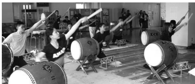
(尾張新次郎太鼓講座)