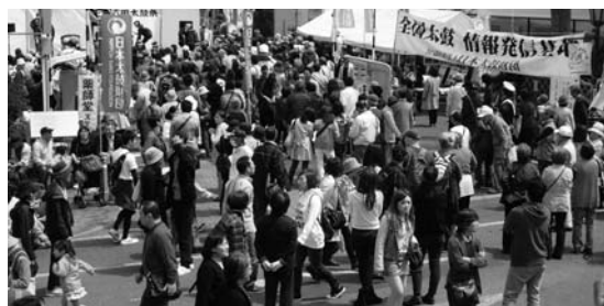
(全国太鼓情報発信基地)

4月18・19日(土日)、千葉県成田市において「成田太鼓祭」が開催され、今年は22万5千人が訪れました。千葉県支部、千葉県太鼓連盟主催、当財団の共催により設置した「全国太鼓情報発信基地」のブースにはおよそ6千人のお客様が訪れ、展示した事業紹介のパネルをご覧いただいたほか、浅野太鼓のご協力を得て設置した大太鼓をお客様に実際に叩いてもらうコーナーでは、多くの方々が太鼓に親しまれていました。