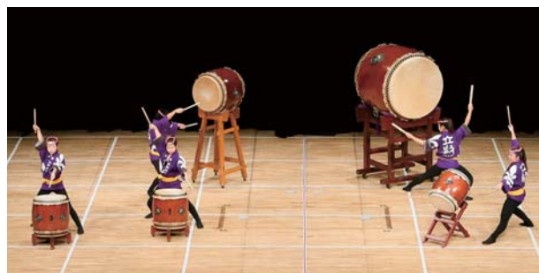
(田中孝記念立教大学コミュニティ福祉学部 和太鼓プロジェクト 絆の会・東京)