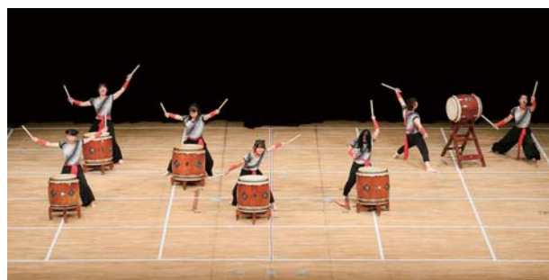
(多摩美術大学 鑪水太鼓・東京)

2019年8月29日(木)、今年と同じ会場の「文京シビックホール大ホール」にて開催いたします。皆様のご来場を心よりお待ちしております。