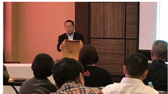
(更新研修会の様子)