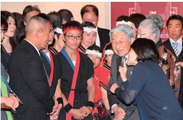
(出場者にお声をかけられる天皇陛下)

10月7日(日)第20回日本太鼓全国障害者大会を東京都文京区の「文京シビックホール大ホール」にて開催いたしました。