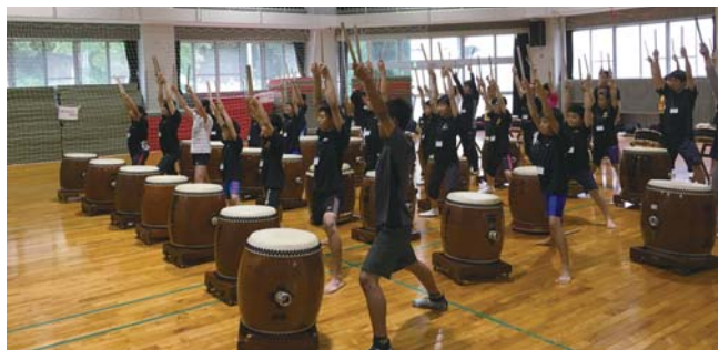
5級基本講座の様子