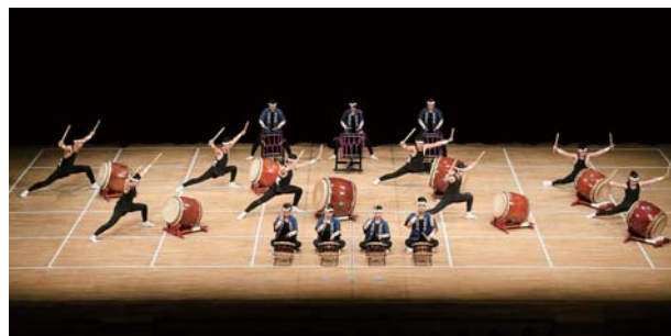
(京都造形芸術大学和太鼓 恵・京都)