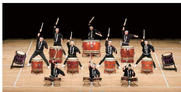
(立命館アジア太平洋大学 和太鼓“楽”・大分)