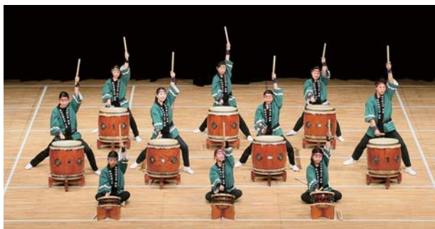
(神田外語大学和太鼓サークル 神楽・千葉)