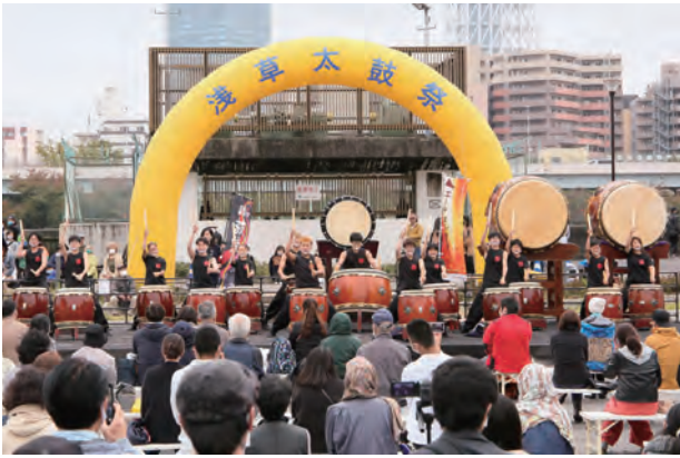
(初出演:吉川太鼓“鼓流”・愛知)