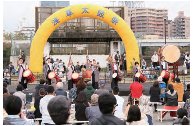
(初出演:和太鼓風-KAZE-・千葉)