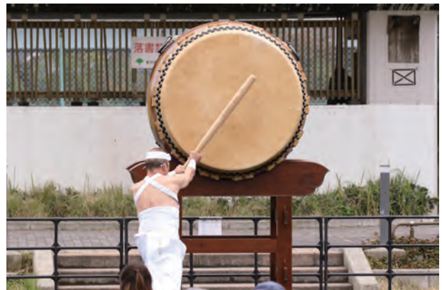
(長谷川副会長による初っ切り太鼓)