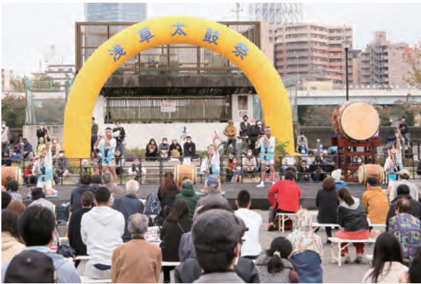
(初出演:尾張新次郎太鼓保存会・愛知)