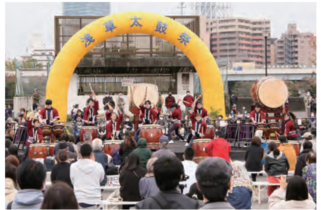
(初出演:大学太鼓連盟合同チーム・東京)