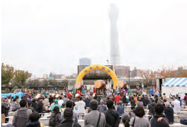
(東京都支部合同チーム)